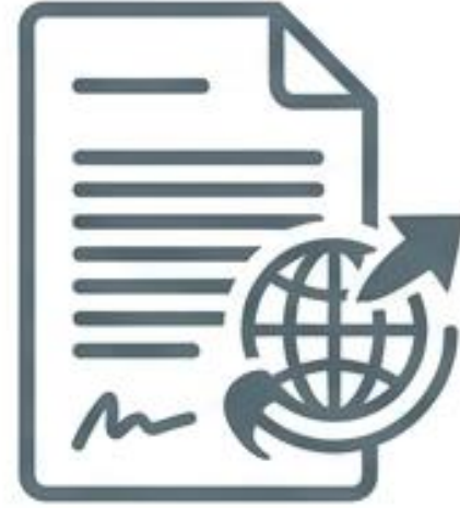
Yeminli Çeviri / Sworn Translation