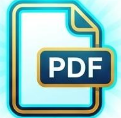
TEK BİR PDF / SINGLE PDF

Lise diplomanız, not durum belgeniz (transkript) veya sınav sonuç belgeleriniz Türkçe veya İngilizce değilse, yeminli çevirileri yapılmalıdır. Orijinal belge ve çevirisi birleştirilerek TEK BİR PDF dosyası olarak yüklenmelidir.